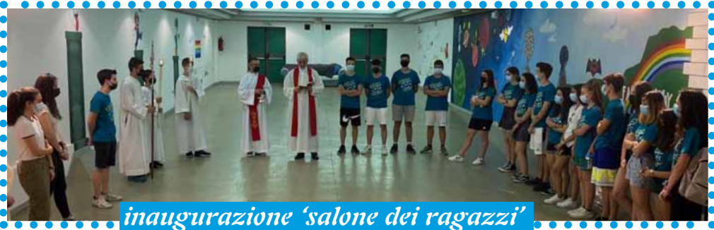
inaugurazione 'salone dei ragazzi'