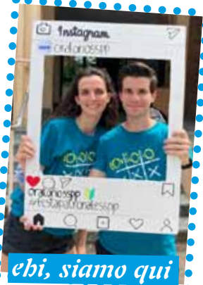
ehi, siamo qui