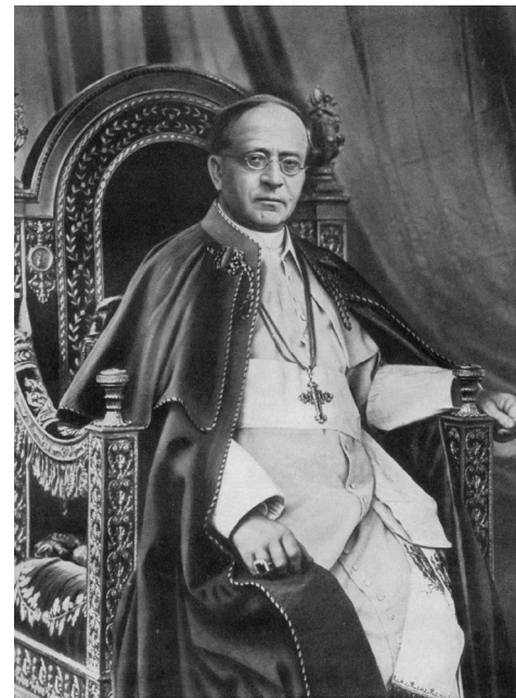
Papa Pio XI, anno 1930

Diocesi metropolitana. In questi pochi mesi visiterà la maggior parte della Diocesi Ambrosiana come dimostra il "Diario" del suo Segretario Particolare monsignor Carlo Confalonieri. Pochi mesi perché, nel 1922, proprio il 6 febbraio, Achille Ratti verrà eletto dai cardinali al soglio di Pietro assumendo il nome di Pio XI.