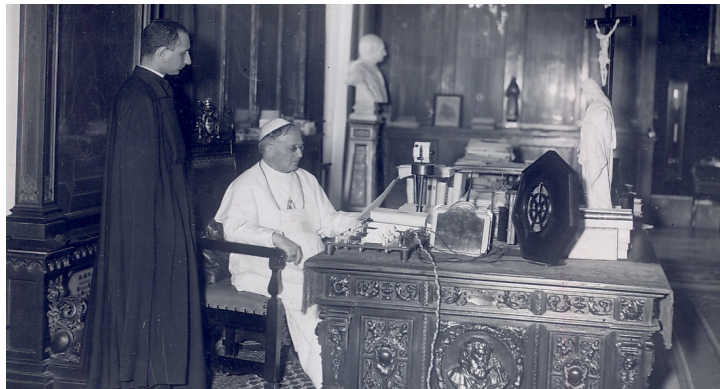
Papa Pio XI, con padre Filippo Soccorsi, direttore della radio Vaticana

■ La Radio Vaticana. È tuttavia universalmente riconosciuto che, con le caratteristiche tipiche del tempo, Pio XI seppe spaziare con il suo magistero su tutti i campi della vita ecclesiale, dalla promozione delle missioni alla difesa della famiglia, dall'impegno dei laici tramite l'Azione Cattolica allo sviluppo delle moderne comunicazioni con la fondazione della Radio Vaticana.