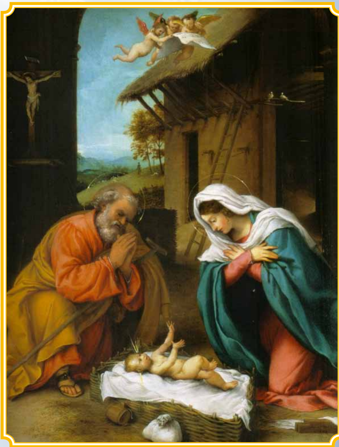
Natività , Lorenzo Lotto, 1523, olio su tavola cm. 46x38 Washington, National Gallery of Art, collezione Kress La piccola tavola è firmata e datata "L. Lotus 1523"