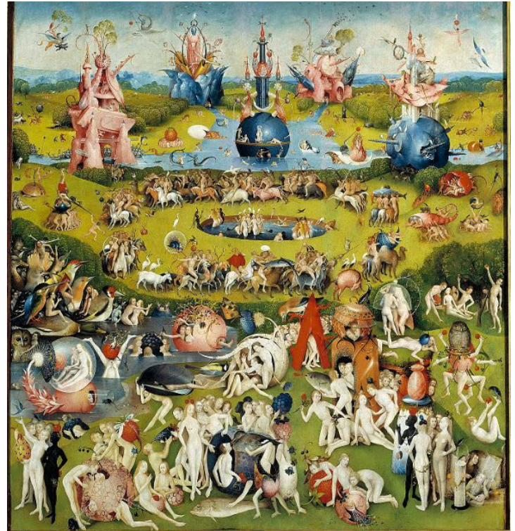
Pannello centrale del "Trittico delle Delizie" - XV secolo

La "felicità", ci chiede Bosch con il piglio del profeta, la si trova nel denaro, nella ricchezza, nei beni terreni? La si può forse raggiungere attraverso il godimento dei piaceri della carne, sessuali o gastronomici che siano? La risposta pare scontata, ma purtroppo l'umanità, da sempre, continua a dimostrare di essere molto più interessata a dei "valori" effimeri ed ingannevoli, piuttosto che a cercare la