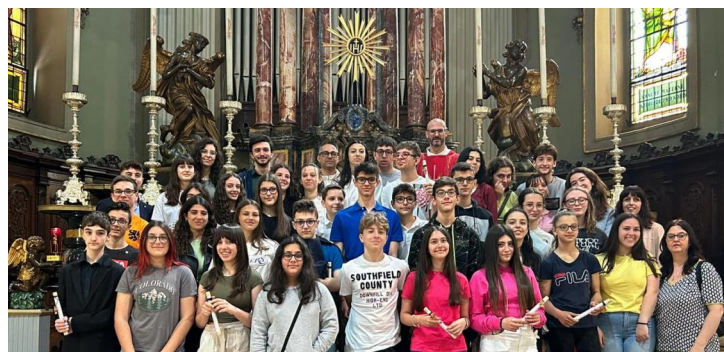
Domenica scorsa, nel corso della santa Messa i preadolescenti di 3ª media hanno celebrato la loro Professione di Fede. Buon cammino ragazzi!

Per informazioni ed adesioni non esitare e contatta il Servizio Educativo: telefono 0362-616211 , oppure via e-mail: animazione@casadiriposogavazzi.it