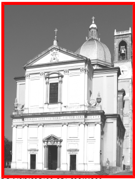
MATERNO IN DESIO